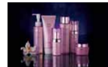
ラン花エキスを配合した化粧品