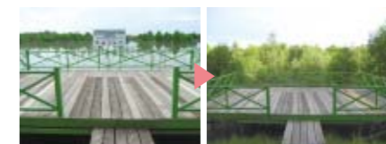
マングローブ林の自然環境保護を目的とした「生命の森プロジェクト」。生長した「生命の森」

現在までに植林したマングローブの数は約5万本。インドネシアWWF*・タラカン市・ニチレイフレッシュが共同で設