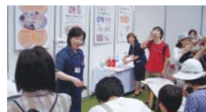
食育推進全国大会の様子

ニチレイフーズは、2008年6月に行われた第3回食育推進全国大会「ぐんま食育フェスタ2008」に、NPO法人 日本食育士協会と共同で参画しました。ここでは、「味と香りの体験：おいしさはどのように感じるのか？」をテーマに、アセロラドリンクを試飲しながら味覚と嗅覚の相互関係を体感するワークショップ