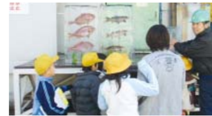
西京物流センターの見学の様子

また、ポートアイランド物流センターでは、兵庫県教育委員会主導の職場体験週間「トライやるウィーク」に協力し、2008年6月と11月の2回、神戸市内の5中学校から10名の生徒の校外学習を受け入れました。外貨コンテナの荷卸し作業の見学や、金属探知機を使つての体験実習、