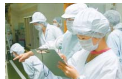
キッズツアーの様子

(株)ニチレイフーズの国内6カ所にある自営工場では、周辺地域の小中学生を対象に「キッズツアー 体験!工場見学」を実施しています。ニチレイフーズの概要説明に始まり、冷凍食品の製造工程を見て学ぶ工場見学のほか、冷蔵倉庫で「冷凍温度」を体感させるなど、体験型の内容になっています。その他、各工場て工夫を凝らした独自のプログラムを実施しています。2008年度は55回のキッズツアーを実施しました。