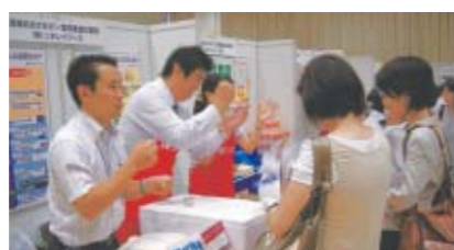
おおさか食育フェスタ2008の様子

ニチレイフーズは、大阪府が主催した「おおさか食育フェスタ2008」に、「健康おおさか21・食育推進企業団」として他の食品企業18社と共に参画しました。展示ブースでは、温かい本格炒め炒飯とスノードライアイスを使用したユニークな冷凍食品作りを行い、多くの方々に冷