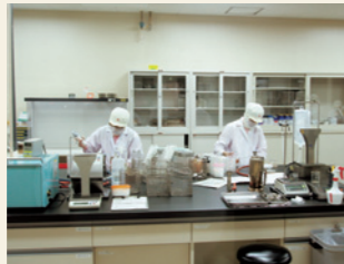
工場での品質管理実施の様子

私たちニチレイフーズは、56年間にわたり国内の直営工場(2008年現在、6工場)において、お客様に安心をお届けするために必要な、独自の品質管理のルールや仕組みを作り上げてきました。この「ニチレイフーズ品質管理基準」による工場審査※に合格した工場だけが、ニチレイフーズの商品を生産しています。審査に合格したグループ工場・協力工場は国内のみならず海外にも広がっています。これからも、品質管理基準を常に見直し、その基準の遵守状況を厳しく監視し続けてまいります。