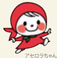
ニチレイアセロラドリンク 発売20周年