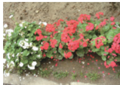
研修センター内の花壇

今後は、この肥料を地域コミュニティとのコミュニケーション活動につなげていくことも検討していきたいと考えています。