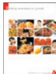
アニュアルレポート