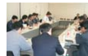
主要生産委託会社に対する説明会(加工食品カンパニー)