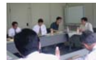
環境影響評価手法についての勉強会(加工食品カンパニー)