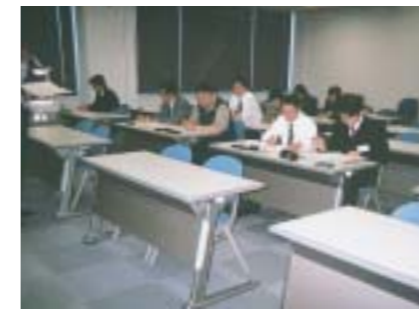
主要実務スタッフ研修

環境保全推進責任者、ISO14001認証取得事業所の推進スタッフなどが、外部講師による内部環境監査員研修を受講しています。この研修は、環境保全に対する取り組みの考え方の基礎となる環境マネジメントシステムの理解促進、ISO認証取得活動の推進者や内部環境監査員の育成などを目的としています。