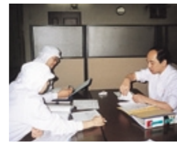
内部監査員による事前打ち合わせ