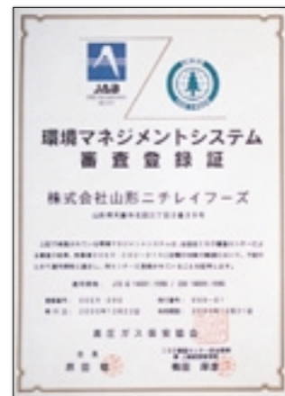
(株)山形ニチレイフーズの審査登録証

2001年度より自営3工場は、分社化により各々(株)ニチレイフーズの工場となっています。