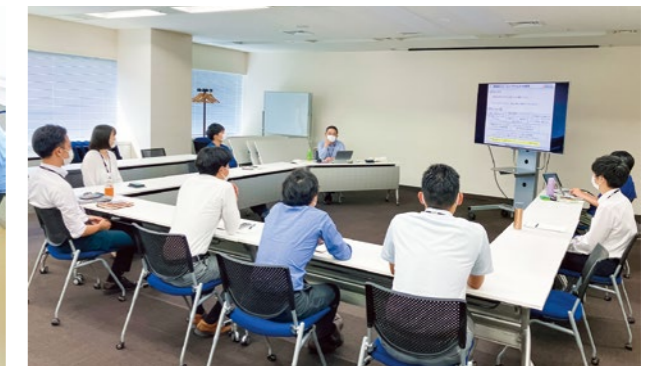
ニチレイフレッシュ 従業員と経営層の対話「OPEN DOOR」