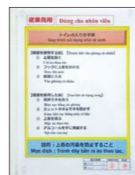
ベトナム語のポスター

ニチレイグループでは、国内食品工場で実習している外国人技能実習生に向け、事前に労働安全衛生などの研修を実施しています。不慣れな日本での生活や日本語上達に向けてのサポートも含め、労働災害の防止や健康管理を目的とした安全衛生管理への理解促進に努めています。