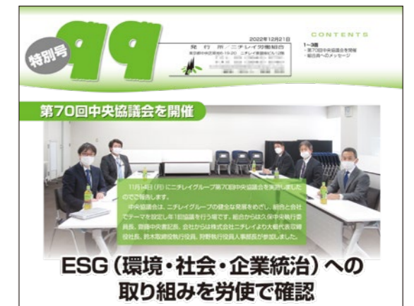
ニチレイ労働組合機関紙「99」

ニチレイグループでは、年1回、労働協約によりグループ全体で開催する労使協議会「中央協議会」を設置しています。グループの事業発展、業務運営の向上、組合員の福祉増進などについて、経営層の委員13名、組合員側委員13名が率直な意見交換を行っています(新型コロナウイルス感染症のため、2022年度は規模を縮小して開催しました)。