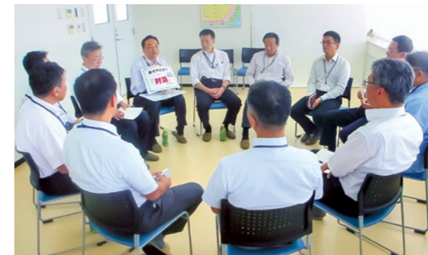
ニチレイフーズ 従業員と経営層の対話「あぐら」

ニチレイフーズとニチレイフレッシュでは、ミッション・ビジョンの浸透と風通しのよい職場づくりや現場の声を大切にしたいとの思いから、2011年より毎年、経営層と従業員との対話の会を開催しています。経営層の想いを従業員に直接伝え、従業員は普段思っていることや考えを経営層に話す機会になっています。