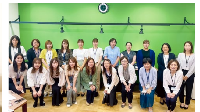
(株)ニチレイ・ロジスティクス関西 ロジ関西 ロジシティ