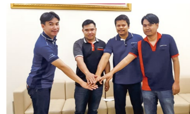
SCG Nichirei Logistics Co., Ltd. エンジニアリングチーム

「選ばれつづける仕事賞(2022年度)」の表彰式 https://nichirei-logi.co.jp/news/2023/20230518.html