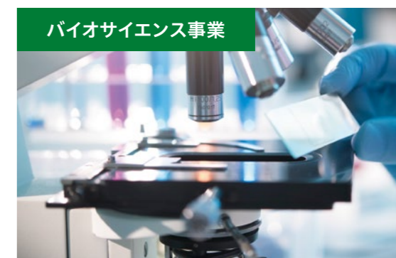
バイオサイエンス事業

3PLや輸配送を軸とした物流ネットワーク事業と、各地域に密着した保管・配送サービスを提供する地域保管事業、欧州・中国・タイ・マレーシアで展開している海外事業、低温物流設備の企画・設計から保守管理までを行うエンジニアリング事業で構成される、国内最大規模の低温物流事業グループです。サプライチェーン全体にわたって高品質なサービスを提供します。